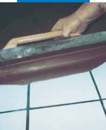
Stesura con spatola metallica di Ultraplan su pavimento esistente in ceramica previa applicazione di Mapeprim SP