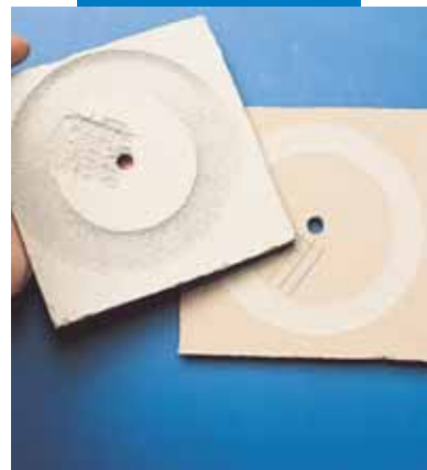
Abrasione Taber eseguita su Ultraplan (provino di destra) e rasatura convenzionale (provino di sinistra) dopo 200 giri