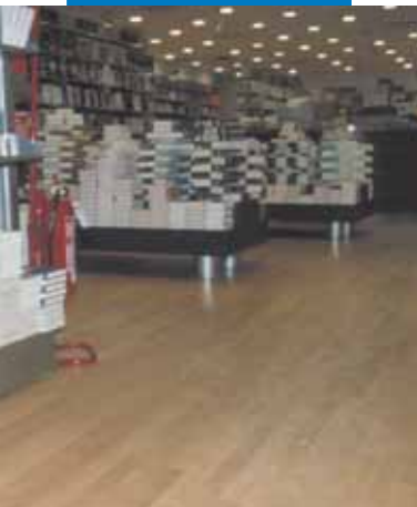
Esempio di posa di legno effettuata su livellatura in Ultraplan - Messaggerie Musicali - Roma - Italia