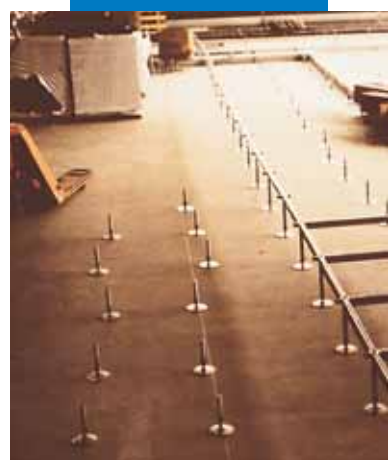
Soletta livellata con Ultraplan per messa in opera di pavimenti galleggianti