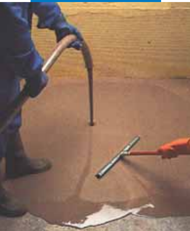
Applicazione di Ultraplan con pompa e successiva raclatura

Ultraplan può essere pulito, finché fresco, dalle mani e dagli attrezzi con acqua.