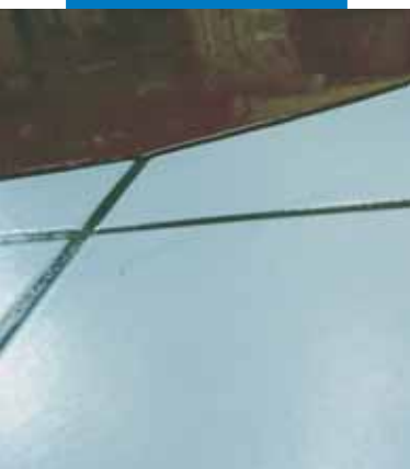
Particolare dell'applicazione di Ultraplan su pavimento in ceramica esistente previa applicazione di Mapeprim SP