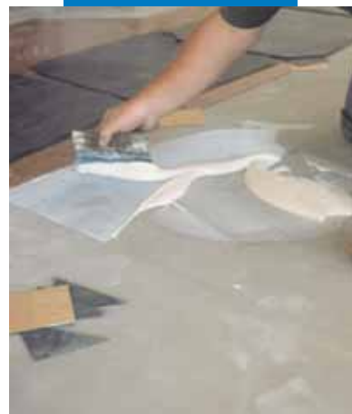
Esempio di posa di PVC (a intarsio) su lisciatura in Ultraplan - CD 2 - Milano - Italia