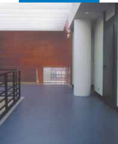
Esempio di posa di linoleum effettuata su livellatura in Ultraplan - Conservatorio di Monzón - Spagna